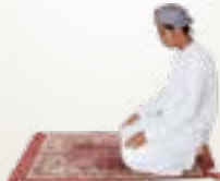
ഇരിക്കാനായി അല്ലാഹു അക്ബർ എന്ന് പറയുമ്പോൾ