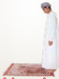
നിൽക്കാനായി സമീ അല്ലാഹു ലി മൻ ഹമിദ എന്ന് പറയുക.