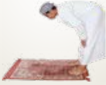
കുനിയുമ്പോൾ "അല്ലാഹു അക്ബർ" എന്ന് പറയുക

സുബ്ഹാന റബ്ബിയൽ അളിം എന്ന് മൂന്ന് തവണ പറയുക (അല്ലാഹുവിന്റെ മഹത്വത്തെ ഞാൻ വാഴ്ത്തുന്നു)